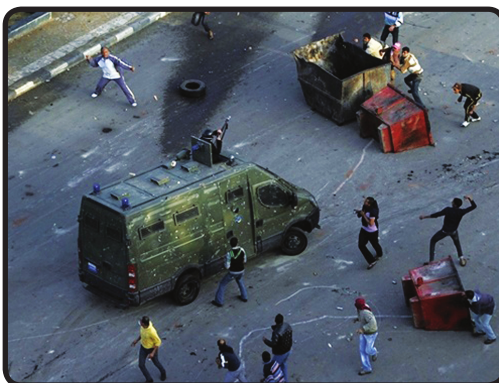
En Égypte: les manifestant.es attaquent une van de flics anti-émeutes