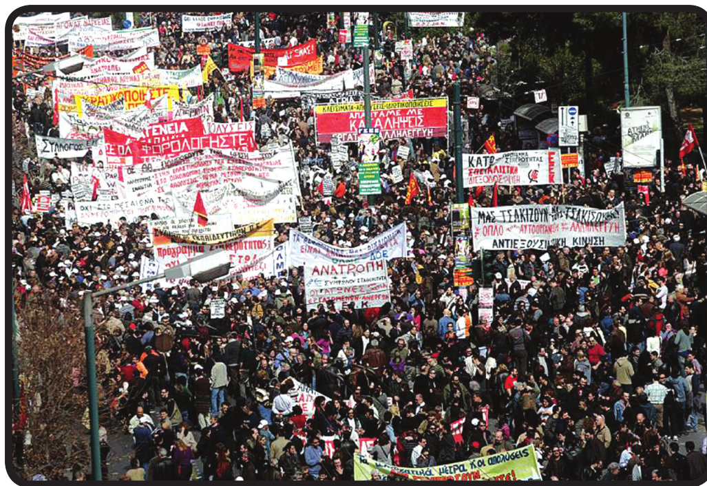
En Grèce: une manif durant la grève contre l'austérité

LE CAPITALISME, C'EST LA CRISE! LUTTONS POUR LA VIE ET LA LIBERTÉ, PAS SEULEMENT POUR LA SURVIE!